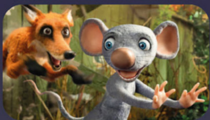
Myši patří do nebe