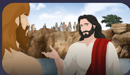
Bůh je s námi