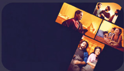
47 dní s Ježíšem