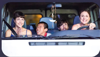
Jen samé krásné věci